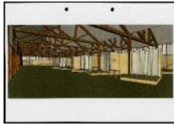
Project 30 : Marina Abramovi (P30)