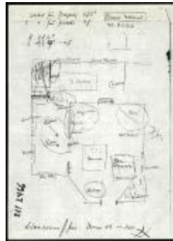
Project 02 : Harald Szeemann (P02)