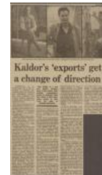
Project 08 : An Australian Accent (P08)