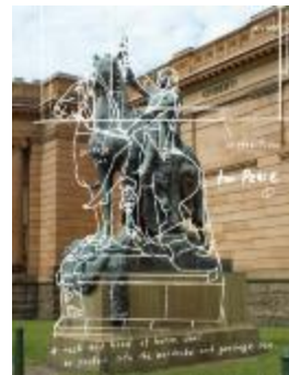
Project 19 : Tatzu Nishi (P19)