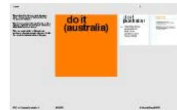
Project 36 : do it (australia) (P36)