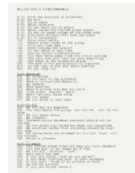
Project 12 : Vanessa Beecroft (P12)