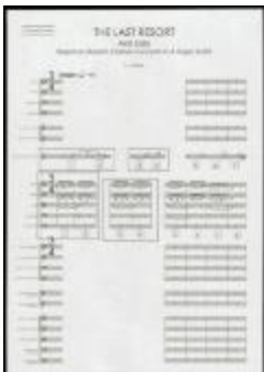
Project 33 : Anri Sala (P33)