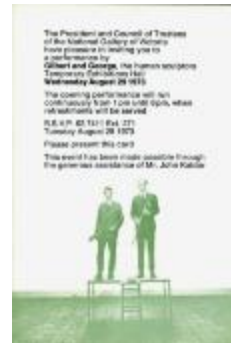
Project 03 : Gilbert & George (P03)