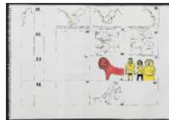
Project 35 : Making Art Public (P35)