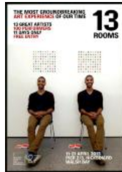
Project 27 : 13 Rooms (P27)