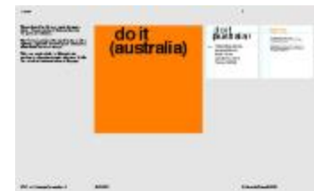
Project 36 : do it (australia) (P36)