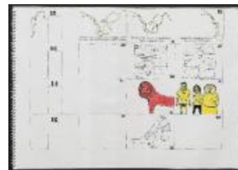
Project 35 : Making Art Public ; Michael Landy (P35)