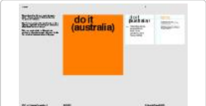
Project 36 : do it (australia) (P36)