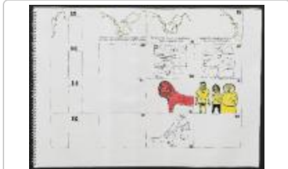
Project 35 : Making Art Public (P35)