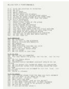
Project 12 : Vanessa Beecroft (P12)