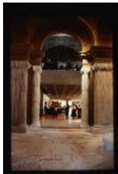
Project 09 : Christo and Jeanne-Claude (P09)