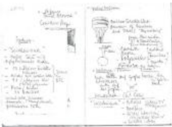
Project 25 : Thomas Demand (P25)