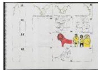
Project 35 : Making Art Public ; Michael Landy (P35)