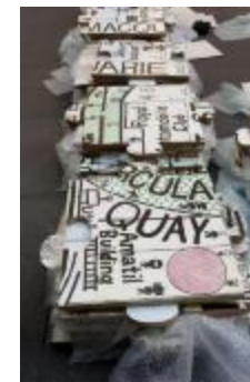
Project 24 : Michael Landy (P24)