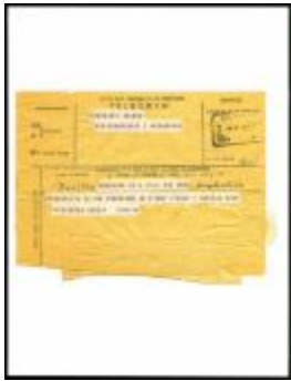
Project 01 : Christo and Jeanne-Claude (P01)