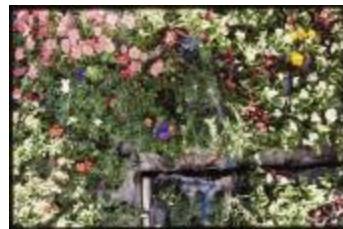
Project 10 : Jeff Koons (P10)