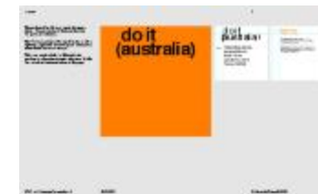
Project 36 : do it (australia) (P36)