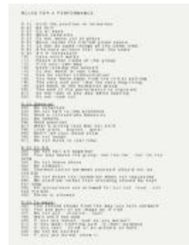
Project 12 : Vanessa Beecroft (P12)