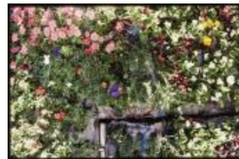
Project 10 : Jeff Koons (P10)