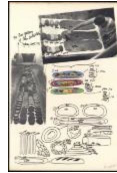
Project 04 : Miralda (P04)