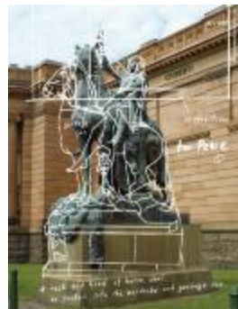
Project 19 : Tatzu Nishi (P19)