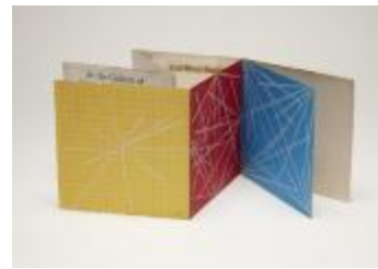
Project 06 : Sol LeWitt (P06)