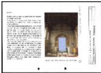
Project 17 : Bill Viola (P17)