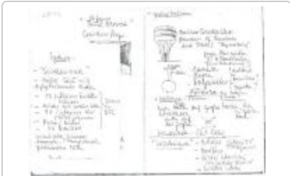
Project 25 : Thomas Demand (P25)