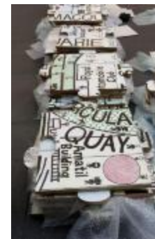
Project 24 : Michael Landy (P24)