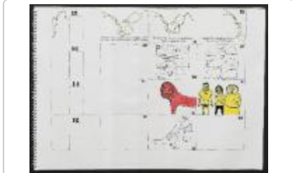
Project 35 : Making Art Public ; Michael Landy (P35)