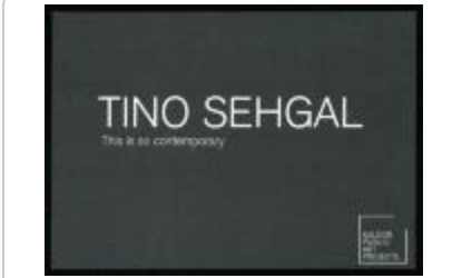
Project 29 : Tino Sehgal (P29)