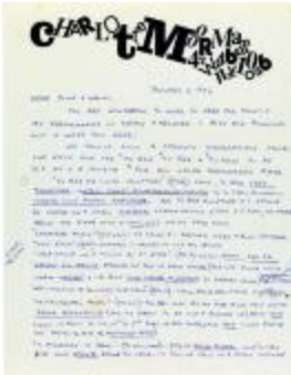
Project 05 : Charlotte Moorman and Nam June Paik (P05)