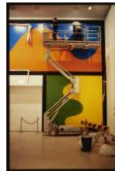
Project 11 : Sol LeWitt (P11)