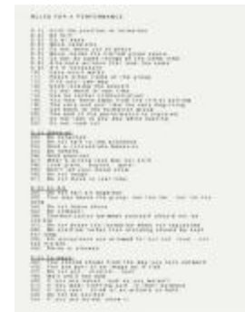
Project 12 : Vanessa Beecroft (P12)