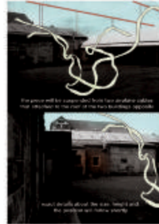
Project 15 : Urs Fischer (P15)