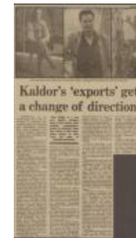
Project 08 : An Australian Accent (P08)