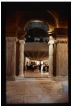
Project 09 : Christo and Jeanne-Claude (P09)