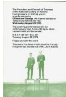
Project 03 : Gilbert & George (P03)