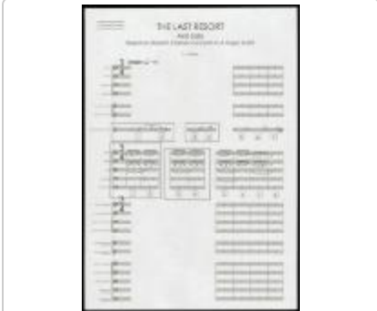
Project 33 : Anri Sala (P33)