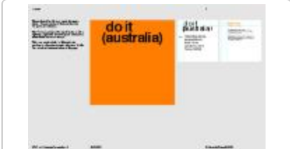
Project 36 : do it (australia) (P36)