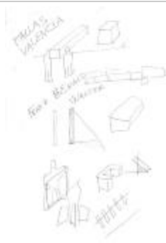
Project 22 : Santiago Sierra (P22)