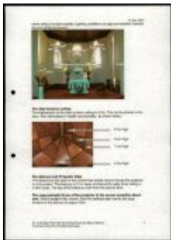
Project 21 : Bill Viola (P21)