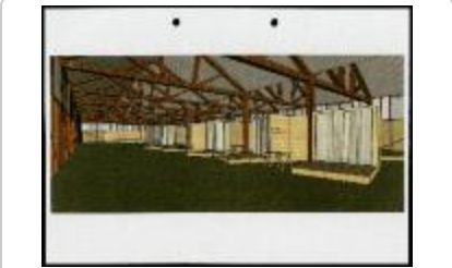
Project 30 : Marina Abramovi (P30)