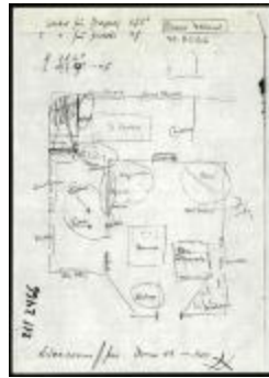
Project 02 : Harald Szeemann (P02)