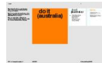
Project 36 : do it (australia) (P36)