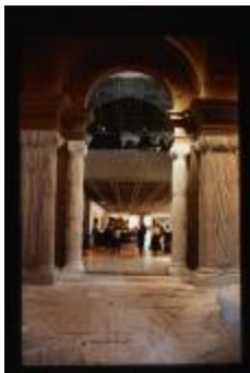
Project 09 : Christo and Jeanne-Claude (P09)