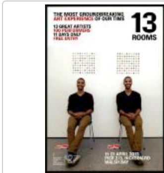
Project 27 : 13 Rooms (P27)