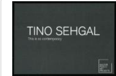
Project 29 : Tino Sehgal (P29)