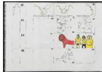
Project 35 : Making Art Public ; Michael Landy (P35)