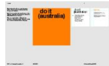
Project 36 : do it (australia) (P36)