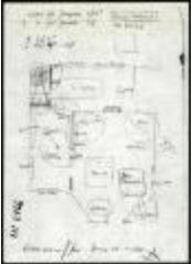
Project 02 : Harald Szeemann (P02)