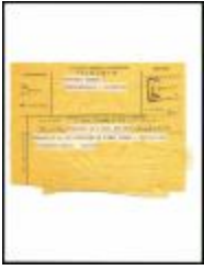
Project 01 : Christo and Jeanne-Claude (P01)