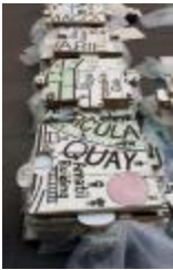
Project 24 : Michael Landy (P24)