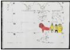
Project 35 : Making Art Public (P35)