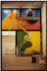
Project 11 : Sol LeWitt (P11)