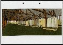
Project 30 : Marina Abramovi (P30)