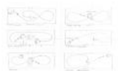
Project 26 : Allora & Calzadilla (P26)