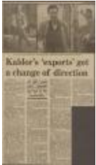
Project 08 : An Australian Accent (P08)