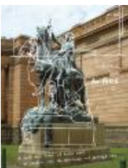
Project 19 : Tatzu Nishi (P19)