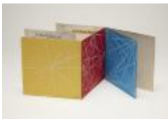
Project 06 : Sol LeWitt (P06)