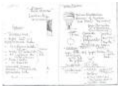
Project 25 : Thomas Demand (P25)