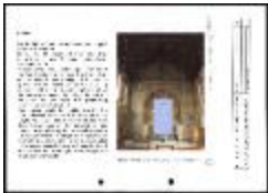
Project 17 : Bill Viola (P17)