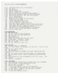
Project 12 : Vanessa Beecroft (P12)