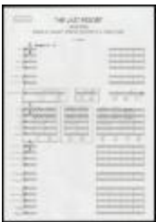
Project 33 : Anri Sala (P33)