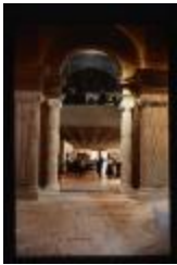
Project 09 : Christo and Jeanne-Claude (P09)