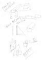
Project 22 : Santiago Sierra (P22)