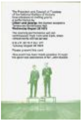
Project 03 : Gilbert & George (P03)