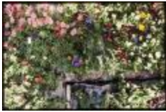
Project 10 : Jeff Koons (P10)