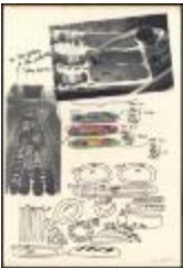
Project 04 : Miralda (P04)