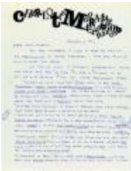
Project 05 : Charlotte Moorman and Nam June Paik (P05)