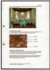
Project 21 : Bill Viola (P21)