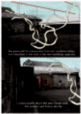
Project 15 : Urs Fischer (P15)