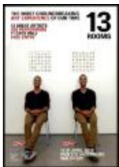
Project 27 : 13 Rooms (P27)