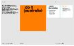
Project 36 : do it (australia) (P36)