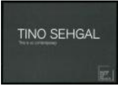
Project 29 : Tino Sehgal (P29)