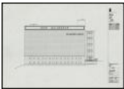
Project 23 : John Baldessari (P23)