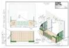
Project 28 : Roman Ondak (P28)