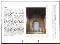
Project 17 : Bill Viola (P17)