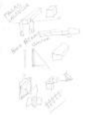
Project 22 : Santiago Sierra (P22)