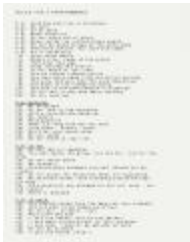
Project 12 : Vanessa Beecroft (P12)